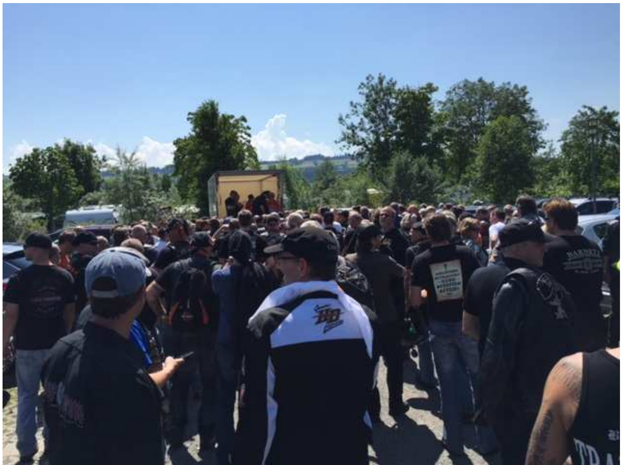
Nach der Ansprache der Organisatoren ging es endlich los.