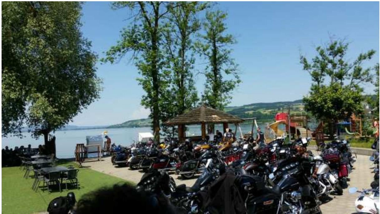
Ankunft in Sempach und warten auf den Startschuss um 1500 Uhr.