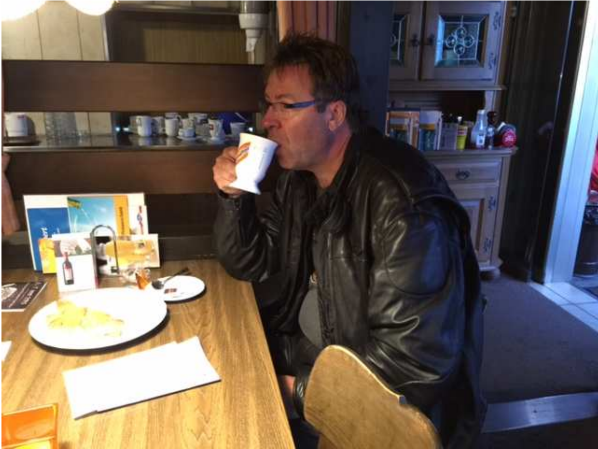
Morgenverpflegung der abgekämpften Ritter.